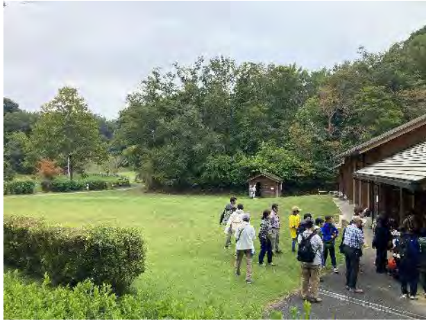
芝生広場と子ども交流館（右）