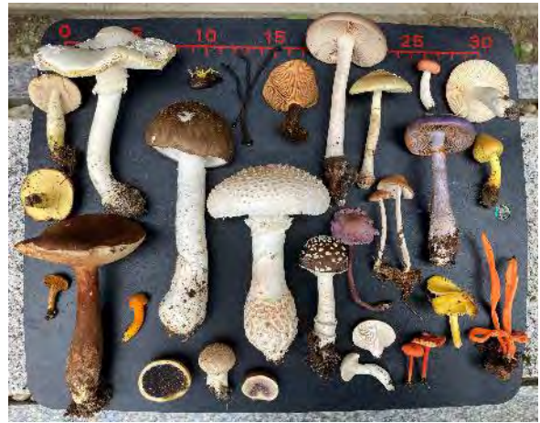
昨年の関西菌類談話会観察会の主な採集品